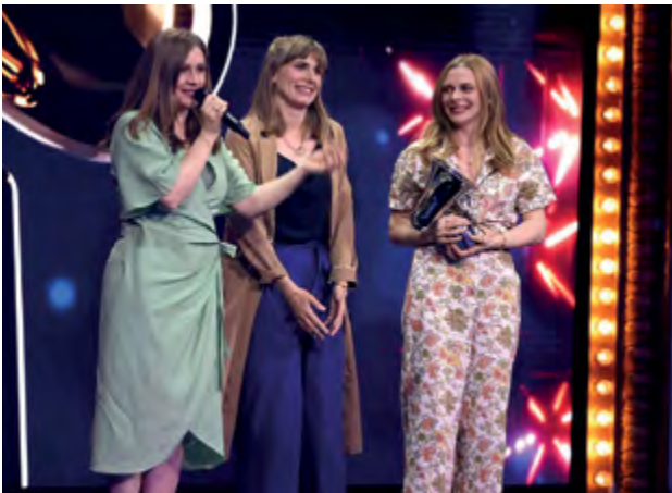
Die Poxrucker Sisters gewannen 2023 den Amadeus Austrian Music Award in der Kategorie „Songwriter des Jahres“