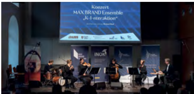
Konzert des Max Brand Ensembles