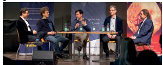
Panelrunde (Teilnehmer s.o.)