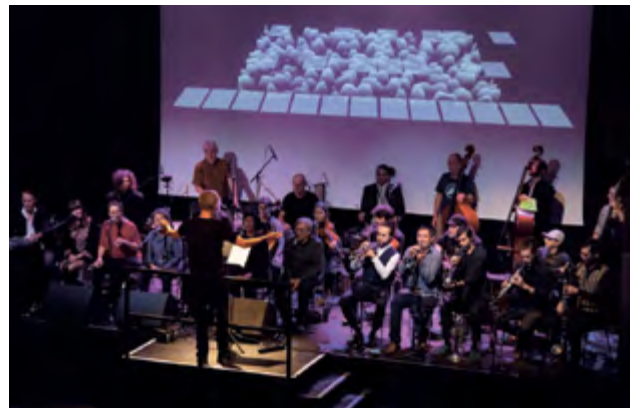
Styrian Improvisers Orchestra