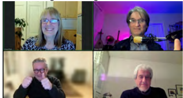
Die Fachjury bei der ersten Jurysitzung

Zusätzlich dazu musste eine weitere Komposition mit freier Besetzungsauswahl eingereicht werden.