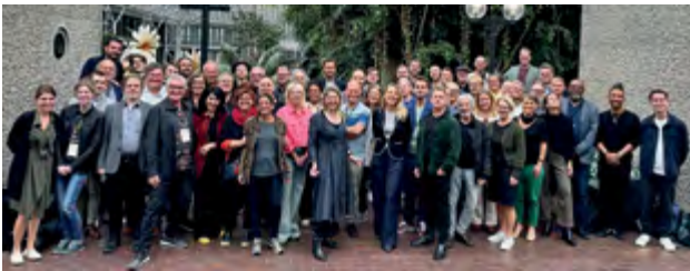
Die Teilnehmer der ECSA-Generalversammlung in Brüssel.

Im März 2023 fand die Generalversammlung der ECSA in Brüssel statt, sowie die jährliche Creators Conference. Mariya Gabriel, bis Mai 2023 EU-Kommissarin für digitale Wirtschaft und Gesellschaft, verfasste dafür ein Statement: „Der europäische Musiksektor steht vor akuten Herausforderungen, von einer Intensivierung des digitalen Wandels bis hin zu einem Bedürfnis nach Nachhaltigkeit in Bezug auf die Umwelt, einer legitimen Hoffnung für mehr Vielfalt, fairer Bezahlung von Kunstschaffenden, Wettbewerb von außerhalb Europas, einem Mangel an Datentransparenz, die Liste geht weiter. Dies macht die Creators Conference signifikanter denn je.“