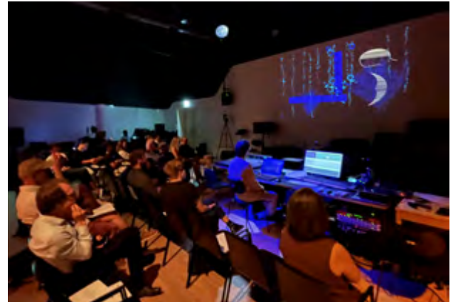
Christoph Renharts generative AV „Music With Moons“ im CMS Sonic Lab

Am 19. Juni 2023 fand der Beitrag des CMS - Computer Music Studios am Institut für Komposition, Dirigieren und Computermusik an der Anton Bruckner Privatuniversität (ABPU) in Linz im Sonic Lab - einem intermedialen Konzertsaal für Computermusik und Mehrkanalkompositionen - statt. Die Leitung und Kuration des Abends lag in den Händen von Andreas Weixler.