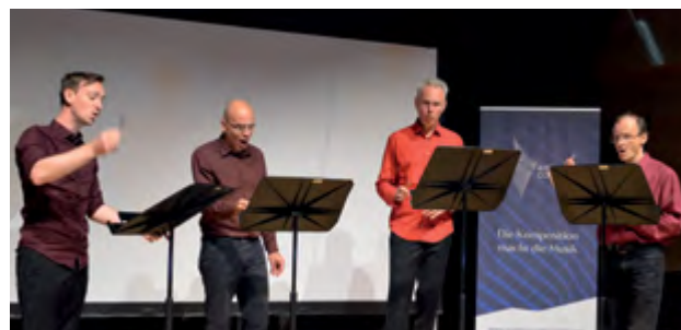
Das Wiener Komponisten Quartett