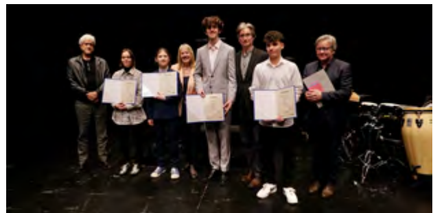
Die PreisträgerInnen von „Jugend komponiert 2023“ mit der Jury.