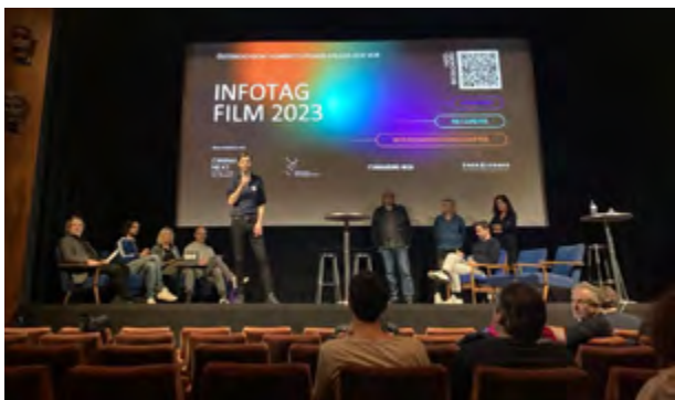
Eröffnung des „Infotag Film“

Am Donnerstag, 23. November 2023 fand auf Initiative von Cinema Next – Junger Film aus Österreich, der Akademie des Österreichischen Films, dem Dachverband der Filmschaffenden und der Filmakademie Wien im Stadtkino Wien zum zweiten Mal ein „Infotag Film“ statt.